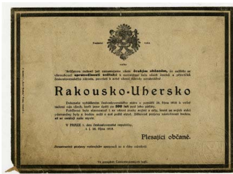
Obr. 3: Žertovné parte o skonu rakousko-uherské monarchie z 28. 10. 1918.

Vyučujete vznik Československa? Najděte a prostudujte se žáky digitalizovaný první zákon Československé republiky, napsaný Aloisem Rašínem, či žertovné parte o skonu rakousko-uherské monarchie.