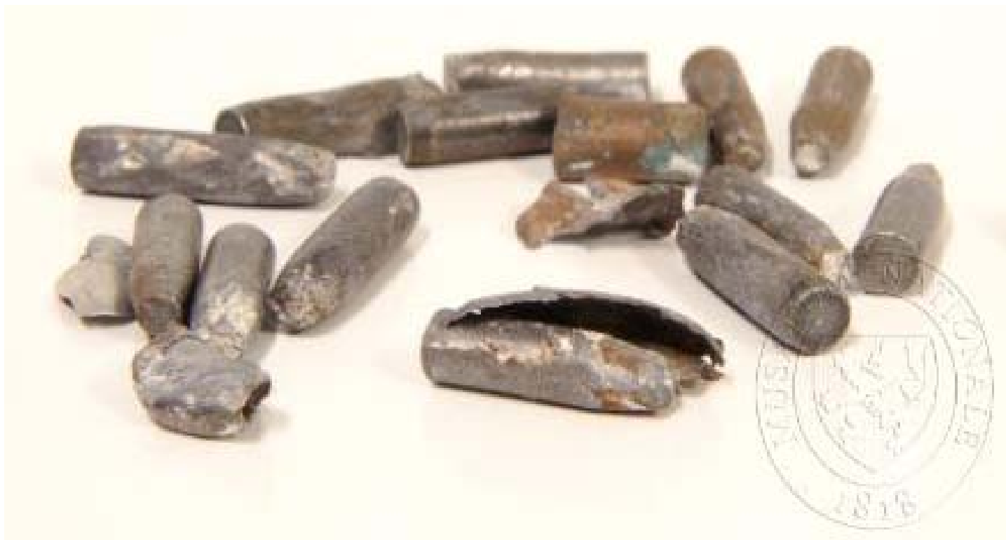
Obr. 6: Střely ze srpna 1968, které poškodily fasádu Národního muzea. Národní muzeum.

Vyučujete rok 1968, Pražské jaro a události kolem upálení Jana Palacha? Poslechněte si záznamy z archivu Rádía Svobodná Evropa. Podívejte se také na sovětské střely, které 21. srpna 1968 poškodily fasádu Národního muzea. Stopy po střelách jsou na fasádě patrné dodnes.