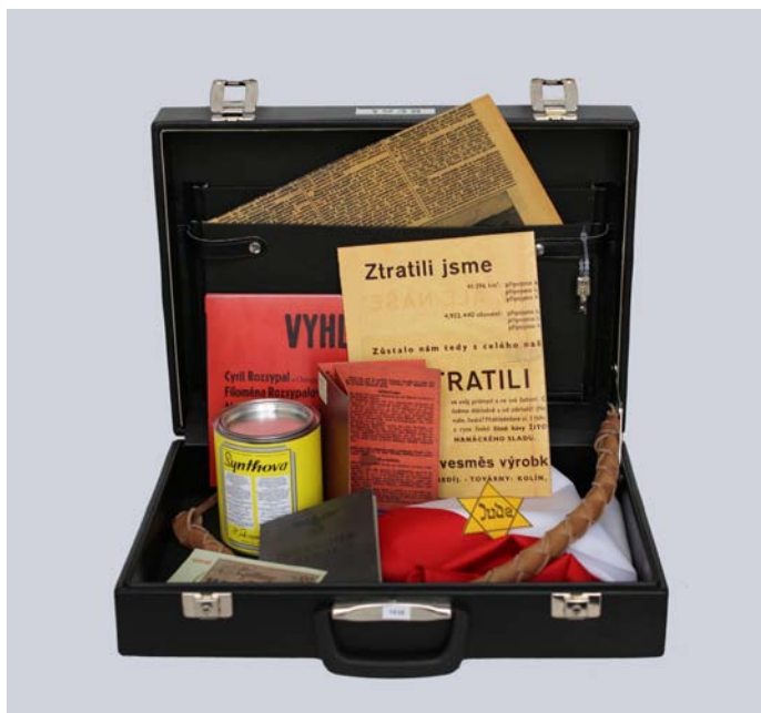
Muzejní kufřík k roku 1938.

Portál dvacatestoletí.eu umožňuje registrovaným uživatelům vytvořit vlastní virtuální 2D nebo 3D výstavu. Pro tvorbu 3D výstav je k dispozici 11 výstavních prostor k libovolnému výběru (včetně např. prostor Národního muzea). Pod administrací pedagoga mají žáci možnost vkládat digitální záznamy předmětů a vytvořit vlastní výstavu včetně popisků k jednotlivým předmětům a doprovodných textových panelů jako na skutečné výstavě. 3D virtuální výstavy jsou dimenzovány na vystavení 12 předmětů, po schválení výstavy pedagogem je výstava publikována na webu. Díky tvorbě virtuální výstavy si žáci a studenti uvědomí význam příběhu předmětu, vypovídací hodnotu předmětu, vyzkouší si badatelskou práci s předměty. Příprava virtuální výstavy může být završením jejich vlastního badatelského projektu.