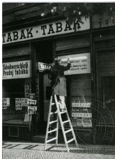
Obr. 5: Odstraňování německých nápisů v Praze. Národní muzeum. Zdroj: http://dvacatestoleti.eu/esbirky/detail/?id=150846&series=39b83d9fc8dd252359dd1a

Probíráte rok 1945 a osvobození Československa? Prohlédněte si dobové fotografie zachycující květnové události v Praze, Brně či např. Ostravě.