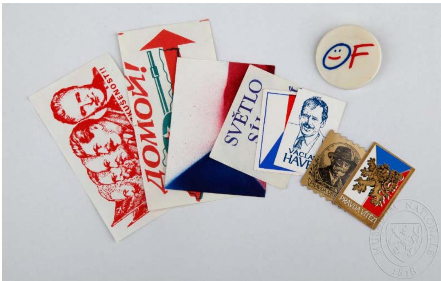
Obr. 7: Ukázka revolučních propagačních předmětů. Národní muzeum.

Čeká Vás hodina věnovaná Sametové revoluci? Na eSbírkách 20. století si můžete prohlédnout např. odznak Občanského fóra či poslechnout audiozáznamy z polistopadového vysílání Rádía Svobodná Evropa.